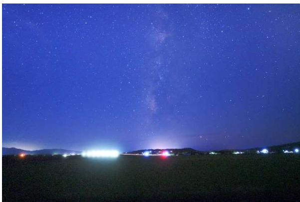
入選「荒崎を渡る天の川」田中繁