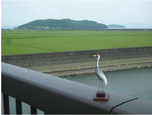
入選「鶴を待つ出水の自然」山口裕和